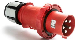
Ref. / Item 14306