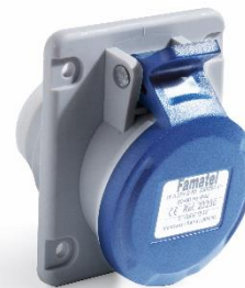
Ref. / Item 23230