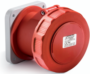
Ref. / Item 24374